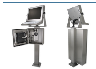
Configuration complète du poste de travail avec coffret PC, clavier, articulation et pied.