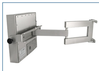
Écran à montage encastrable universel monté sur bras à usage industriel intensif conforme IP65/IP66.