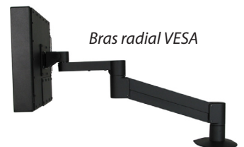
Bras radial VESA

Les trous VESA permettent le montage sur un mur, un plan de travail, un poteau ou une colonne