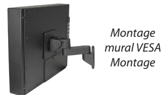
Montage mural VESA Montage