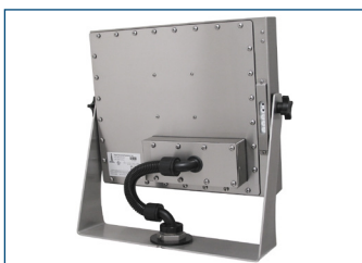
Écran à montage encastrable universel sur articulation murale industrielle avec rallonge KVM.