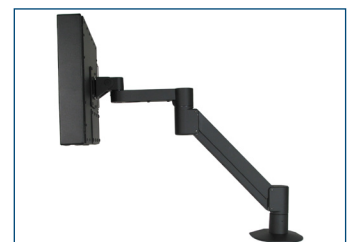
Écran à montage encastrable universel monté sur bras radial VESA.