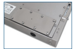
Plaque de recouvrement du trou pilote (IP65/IP66)