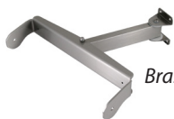
Bras de prolongateur simple

Homologué pour des écrans allant jusqu'à 45 kg !