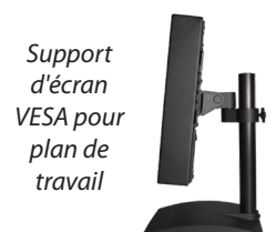
Support d'écran VESA pour plan de travail