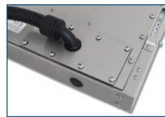
Ensembles sorties de câbles pour conduit (IP65/IP66)