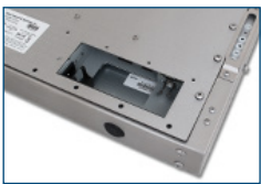
Ouverture vers connecteurs internes