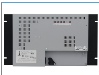
Vue arrière d'écran rackable 15".