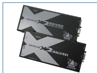
La rallonge KVM en option permet d'installer l'écran jusqu'à 300 m de l'ordinateur.