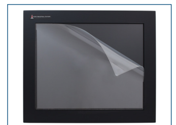
Le protecteur d'écran en option protège les écrans tactiles contre les rayures et l'usure.