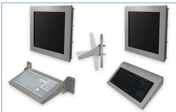
Clavier inclinable à fixation murale (gauche) et clavier mural fixe (droite)