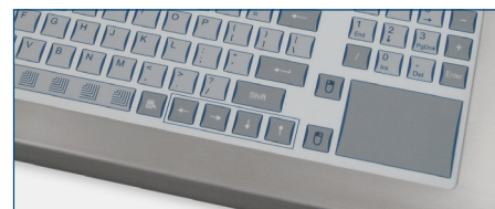
Clavier à distance d'activation courte avec pavé tactile (modèles M2)