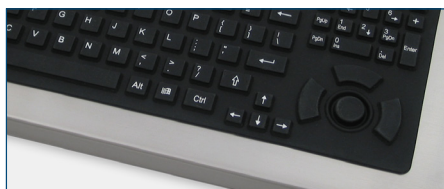
Clavier à distance d'activation longue avec dispositif de pointage (modèles R2)