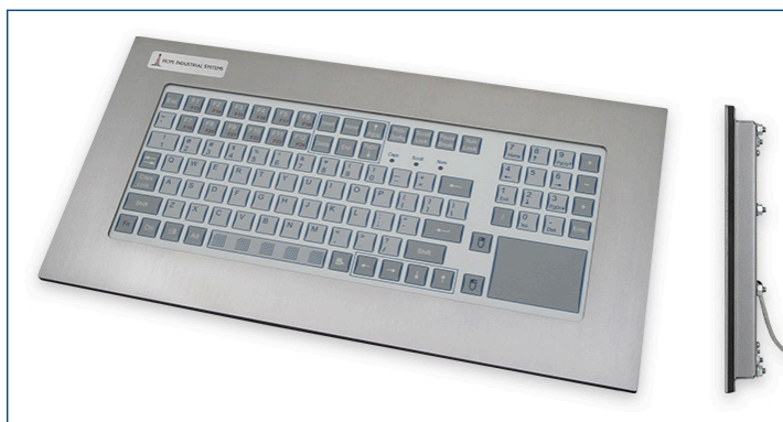
Clavier à montage sur pupitre à distance d'activation courte avec pavé tactile