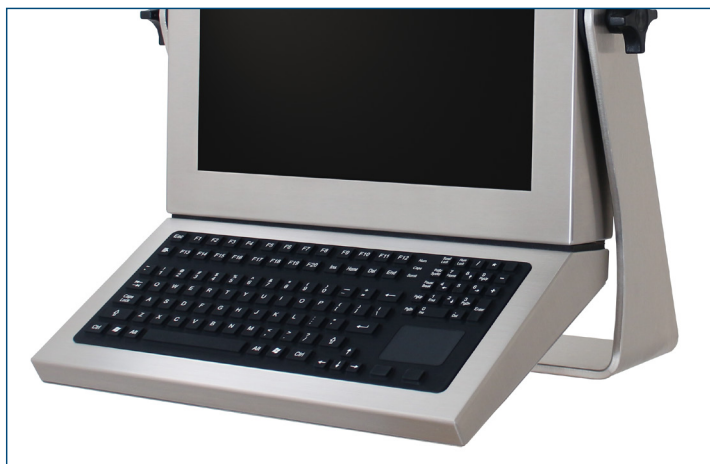
Clavier course longue adaptable sur écran avec pavé tactile